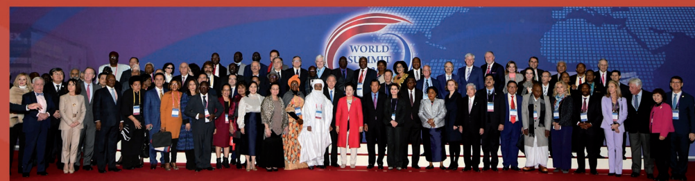
World Summit 2020 - www.worldsummit.or.kr

Il décède en 2012 à l'âge de 92 ans. Son épouse, Hak Ja Han Moon, poursuit le développement des activités dans le monde entier. D'importants groupes religieux commencent à étudier ses enseignements. Le prix Sunhak de la paix est créé pour récompenser des personnes et des organisations qui s'engagent à préserver la paix et protéger l'environnement. Chaque année de grands mariages continuent à être organisés pour des milliers de couples.