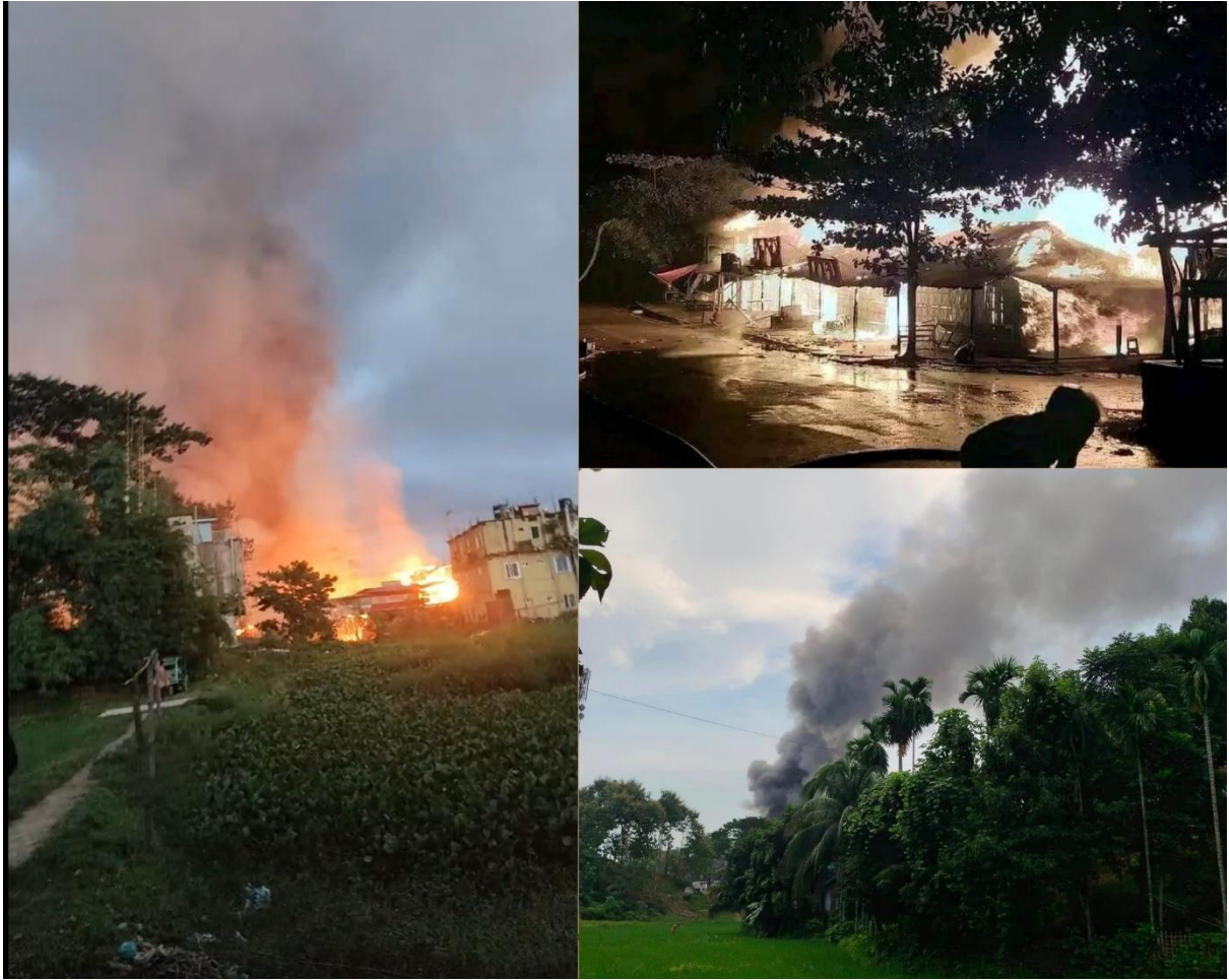
Photo 2: Burning houses and shops of Pahari (Indigenous) villagers, set ablaze by Bengali settlers at Dighinala Sadar, Khagrachari District Bangladesh on September 19, 2024