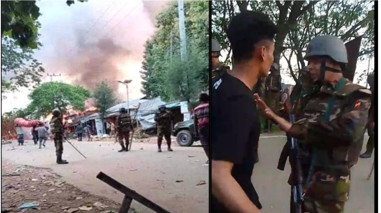
Photo 3: Bangladeshi Military Personnel are seen actively assisting Bengali settlers in setting fires while interrupting Pahari (Indigenous) protesters during the conflict at Dighinala Sadar, Khagrachari District Bangladesh on September 19, 2024