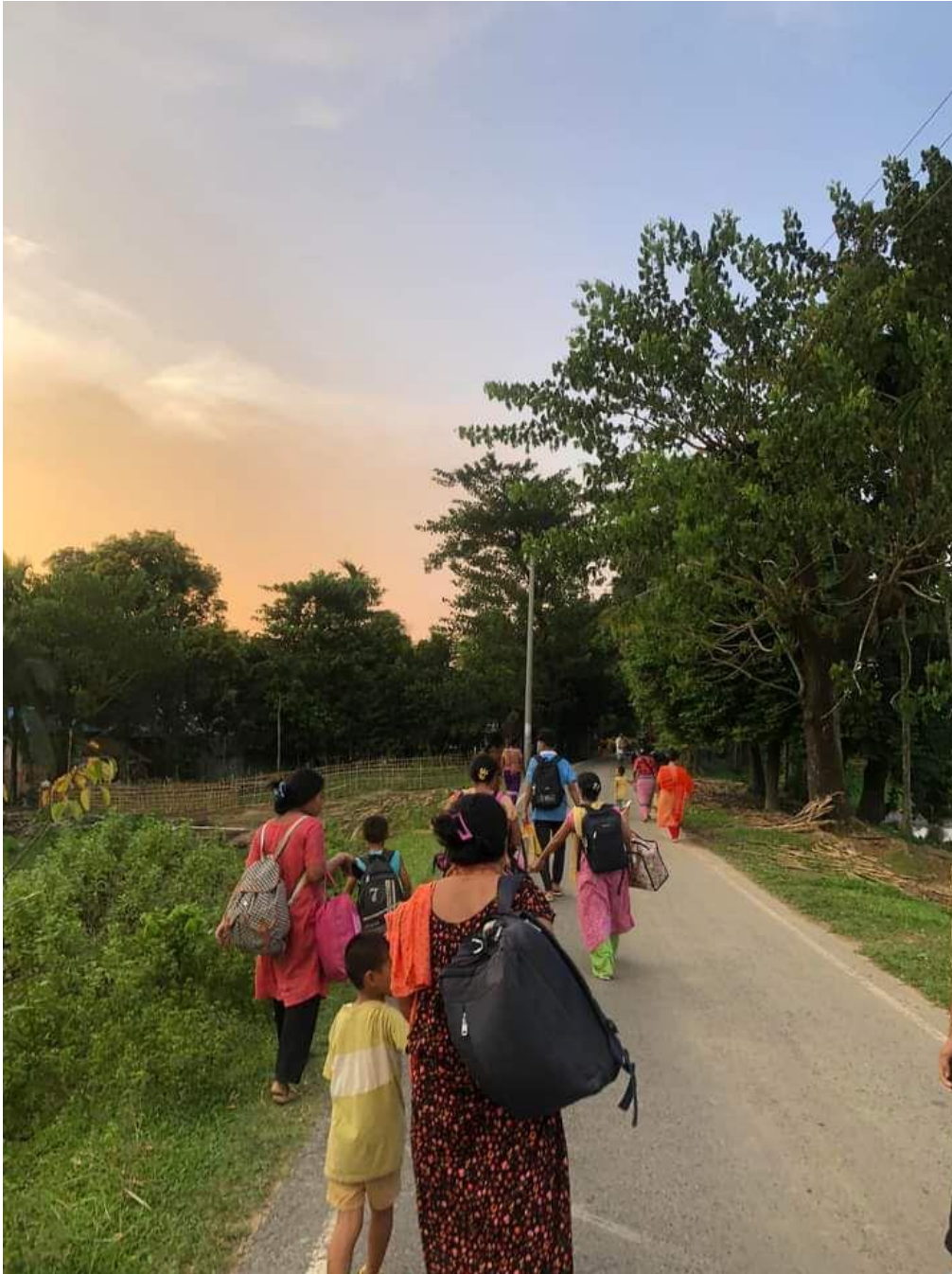
Photo 4: Pahari (Indigenous) villagers flee their homes, rendered homeless after Bengali settlers set fire to their houses and properties at Dighinala Sadar, Khagrachari district, Bangladesh on September 19, 2024.