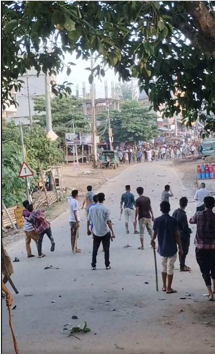
Photo 1: Pahari (Indigenous) villagers attempt to save their homes and shops from Bengali settler attackers at Dighinala Sadar, Khagrachari District, Bangladesh on September 19, 2024.