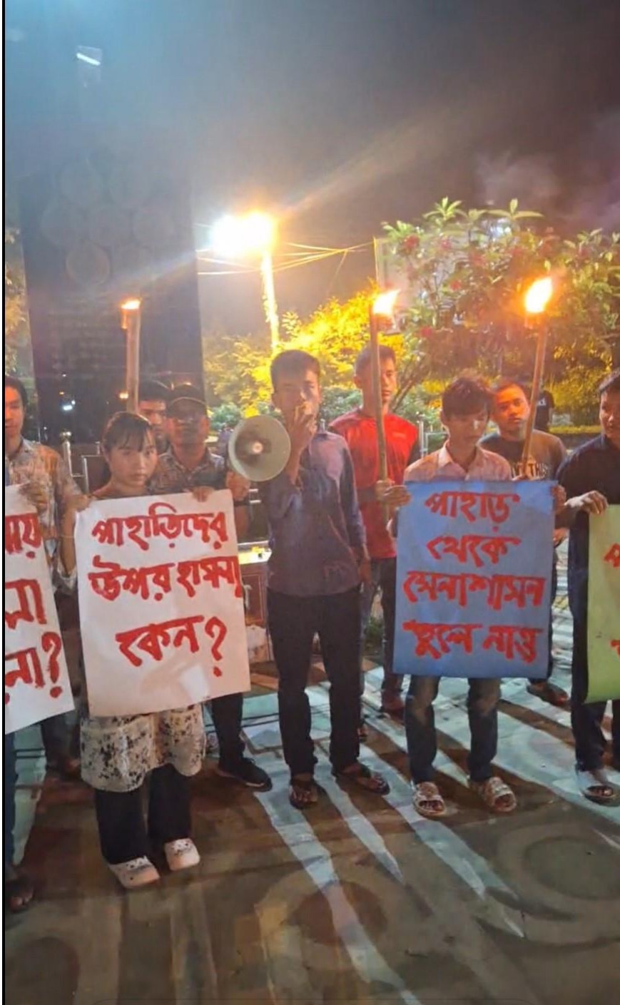
Photo 7: Indigenous students at Chittagong University hold a torch protest in response to the arson attack by Bengali settlers at Dighinala Sadar, Khagrachari district, Bangladesh on September 19, 2024